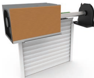
Parement brique (8 mm) Coffre 280