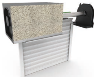
Parement fibre (bois-ciment) Coffre de 280